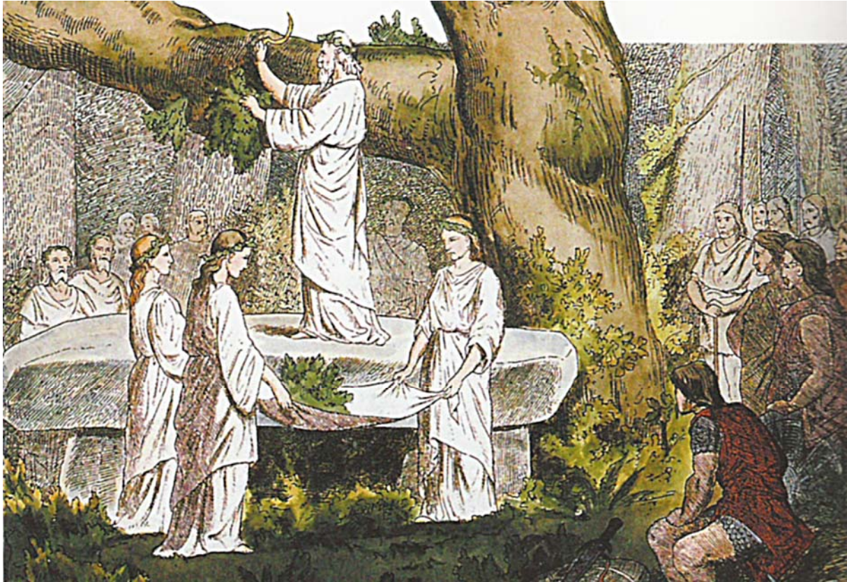
Abb. 2 Romantische Darstellung der keltischen Zeremonie des Mistelschneidens. Der weiß gekleidete Druiden steht auf einem Megalithgrab und schneidet die Misteln mit der goldenen Sichel von einer Eiche ab. Weißgekleidete Jungfrauen halten ein Tuch, in das der Druiden die abgeschnittenen Misteln fallen lässt. So oder ähnlich stellte man sich in der Zeit des 18. und 19. Jahrhunderts das heilige keltische Mistelschnitt-Ritual vor.

des 18. und 19. Jhd. zahlreiche Abbildungen, auf denen Druiden zu sehen sind, die feierlich mit der goldenen Sichel Misteln von Eichenbäumen schneiden. Angeblich sollen goldene Sichel auch zum rituellen Töten weißer Stiere für Opferzwecke genutzt worden sein, eine ebenso unbewiesene Behauptung wie diejenige vom Schneiden der heiligen Misteln. Dass die Mistel eine besondere Bedeutung im keltischen Naturglauben besaß, ist zwar bei mehreren griechisch-römischen Autoren verbürgt, allerdings gibt es keine Beschreibungen, wie und womit das Schneiden dieses „heiligen Gewächses“ vor sich ging.