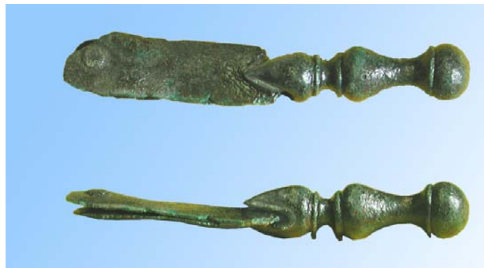
Abb. 1 Fein profilierte keltische Riemenzunge aus Bronze vom Donnersberg. Erhalten sind sogar die dünnen Bronzelappen, zwischen die ein Gürtelende aus organischem Material (Textilien, Leder) geschoben und dann mit dem – bei unserem Exemplar noch erhaltenen – Niet befestigt wurde.

Was genau ist eine „Riemenzunge“? Keltische Gürtel waren entweder aus pflanzlichen Fasern gewebt oder aus den Häuten von Rindern, Ziegen oder Schweinen als Ledergürtel hergestellt. Wollte der Kelte seinen Gürtel als ein besonderes Accessoir der Kleidung betonen, so konnte er dies natürlich tun, indem er den Gürtel verzierte, etwa mit Nieten, oder auch mit Bemalung. Einen besonderen Schmuck stellte aber ein Detail wie unsere Riemenzunge vom Donnersberg dar (Abb. 1): Am Ende des Gürtels angebracht, erleichterte diese Zunge nicht nur das Hindurchschieben des Gürtels durch Schlaufen an der Hose, sondern stellte darüber hinaus auch noch eine besondere Zierde dar.