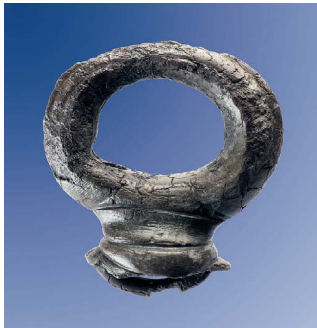
Abb. 1 Bronzener Zügelführungsring vom Donnersberg.

Ein Fundstück, welches dem ungeübten Auge erst einmal seltsam erscheinen mag, ist der in Abb. 1 abgebildete Ring aus Bronze, der nicht rund, sondern eher gedrückt erscheint und unten in einer Art Kappe sitzt. Bei diesem Fundstück, welches uns wichtige Aufschlüsse über den Alltag der Kelten auf dem Donnersberg geben kann, handelt es sich um einen Zügelführungsring. Eine Zügelführung wird überall dort benötigt, wo Zugtiere in ein Joch gespannt werden, um einen Wagen zu ziehen. Häufig waren dies – auch bei den Kelten – Ochsen, welche vor vierrädrige Gefährte gespannt wurden, um Güter zu transportieren – seien dies Getreide-, Gemüse- oder andere Vorratswaren. Aber auch Pferde wurden natürlich als Zugtiere genutzt. Daneben wurden Zügelführungsringe auch für die zweirädrigen Kriegswagen benötigt, die ab dem 4 Jhd. v. Chr. für die Kelten mehr und mehr an Bedeutung gewannen.